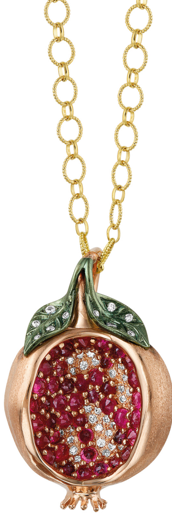
Roségouden hanger granaat met robijn uitgevoerd in 18 krt goud | € 8.645

- Lieke: 'Tijdens het ontwerpen dachten we terug aan momenten waarop we ons goed voelden. Waarop we ons omarmd voelden. Beiden zijn we helemaal gek van de eilandengroep de Seychellen, in de Indische Oceaan. Een prachtige plek waar alles lijkt te zijn betoverd.' - Jetteke: 'Zo'n joy of life... je zwemt tussen de grote zeeschildpadden. En het belangrijkste: de coco de mer. Dat is de grootste kokosnoot ter wereld, groeit alleen op de Seychellen. In deze noot schuilen alle vrouwelijke vormen, het is bijna een kunststuk van de natuur. Bij ons allebei thuis staat de Coco de mer onder een stolp en is zij dagelijks aanwezig.' - Jetteke: 'Zo kwamen we op meer vruchten.'