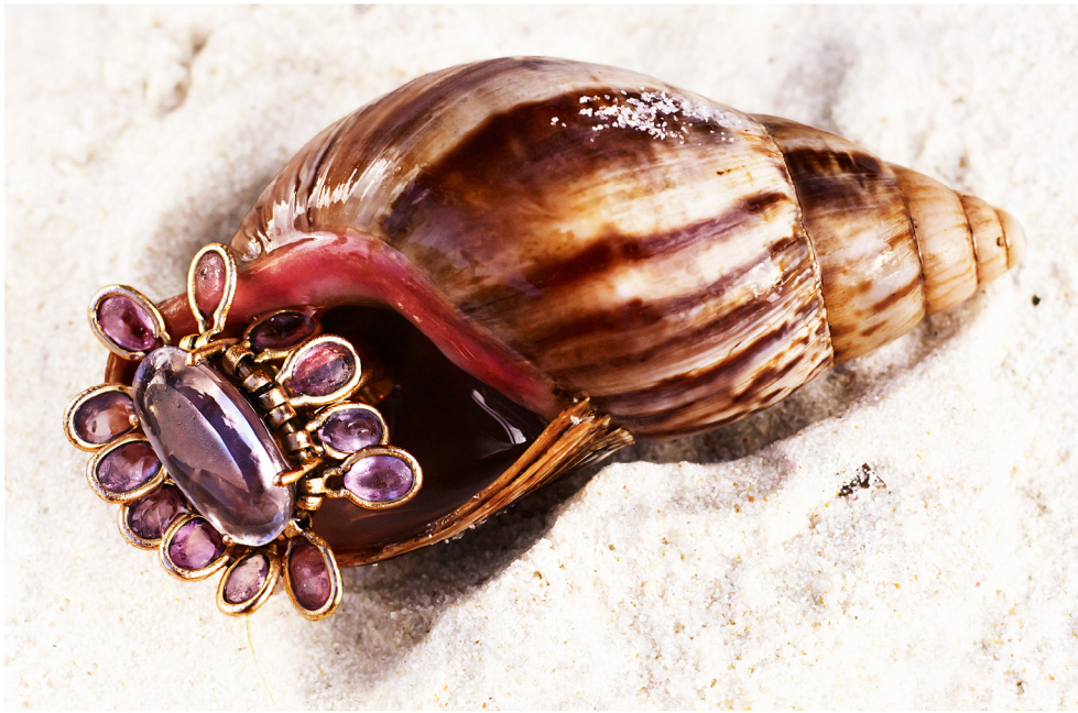
Ring bloem met amethyst uitgevoerd in 18 krt goud