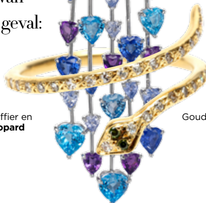
Pauwvormige oorbel met diamant, saffier en alexandriet, € 232.530 per twee Chopard

De natuur is de leermeesteres van de kunst, of in dit geval: