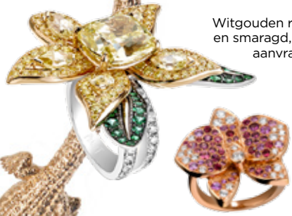
Witgouden ring met diamant en smaragd, unicum, prijs op aanvraag Piaget