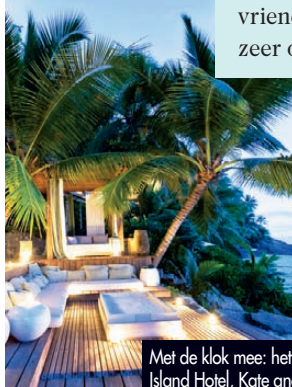
Met de klok mee: het North Island Hotel, Kate and William, het vijfsterren Lemuria Resort en Liz Hurley.