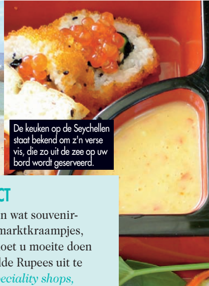
De keuken op de Seychellen staat bekend om z'n verse vis, die zo uit de zee op uw bord wordt geserveerd.